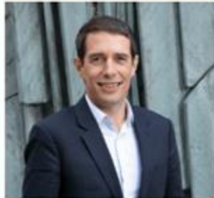
Sylvain MASSONNEAU POUR LA MAISON INDIVIDUELLE