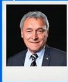
SERGE TRAVERS BRETAGNE ET PAYS DE LA LOIRE